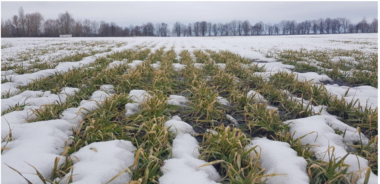
Рис. 3.3. Стан посівів пшениці м'якої озимої за перезимівлі на 01.03.2022 (контрольний варіант)

Надалі посіви пшениці м'якої озимої під час перезимівлі мали візуально гірший стан за максимального поширення хвороб восени (рис. 3.3).