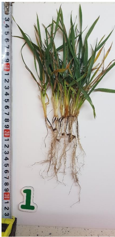
Різомакс + Ф