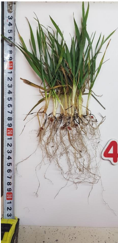
Бінок зерно + Ф