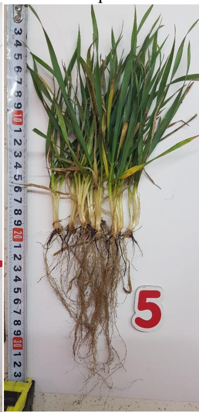
Урожай Старт + Ф