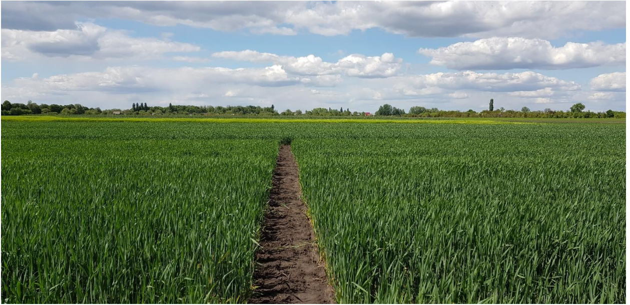
Рис. 2.1. Загальний вигляд дослід за вирощування сорту МПП Валенсія

Сорт високопродуктивний, середньо-ранньостиглий; зимостійкий, посухостійкий. Також стійкий до: вилягання, обсипання, проростання зерна в колосі, борошнистої роси, корневих гнилей, бурої іржі, септоріозу листя, фузаріозу колосу, а також заселення внутрішньостебловими шкідниками. Середньостійкий проти твердої сажки. Натура зерна 814 г/л, вміст сирого протеїну 13,2-14,1%, сирого клейковини – 24,8-28,6%. Сила борошна 280-320 о.а., об'єм хліба до 1100 см 3 . Доволі високоврожайний сорт за умов ґрунтової та повітряної посухи. По всій довжині колоса формує однакову крупність зерна. Хлібопекарські властивості зерна – відмінні.