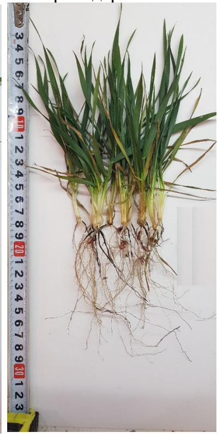
Бінок зерно + Урожай Старт + Ф