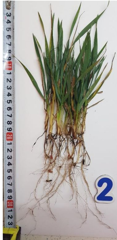
Планориз + Ф