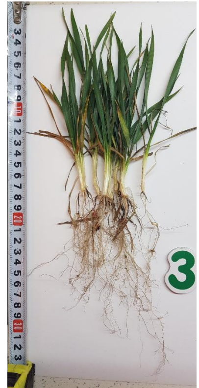
Триходермін + Ф