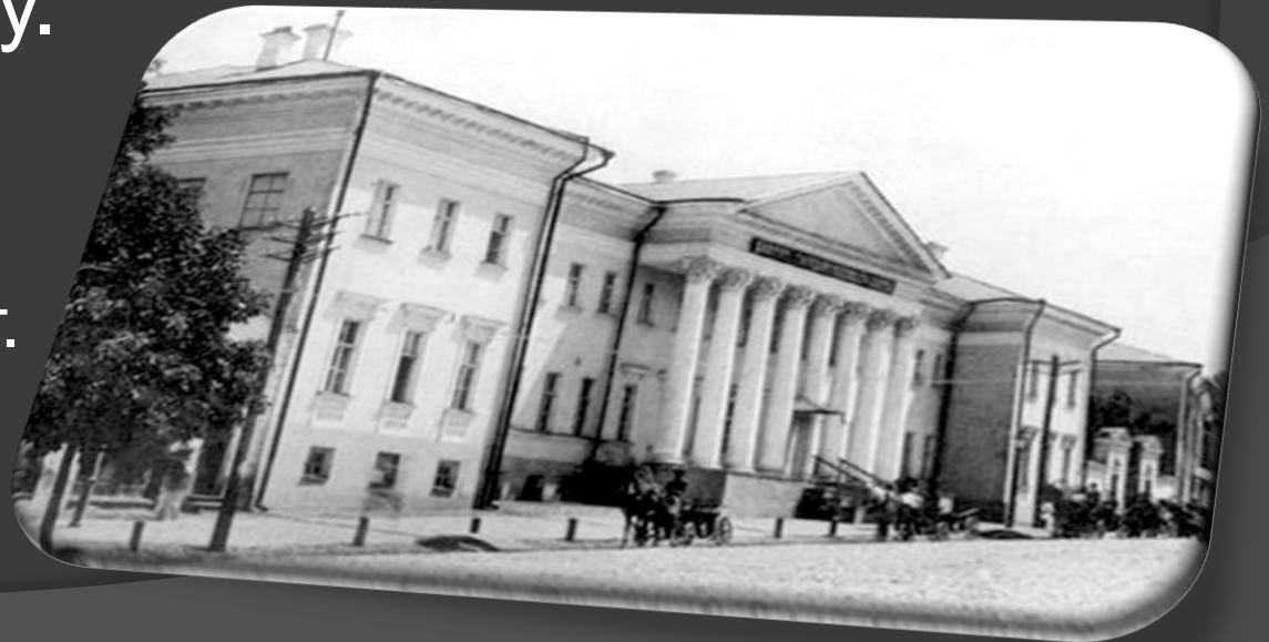
Старий корпус у ХІХ ст.