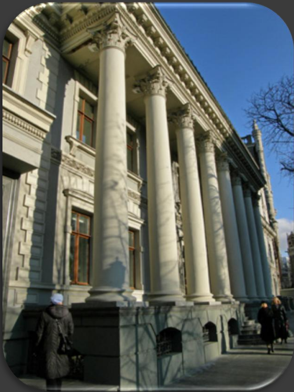
Старий корпус у ХХІ ст.