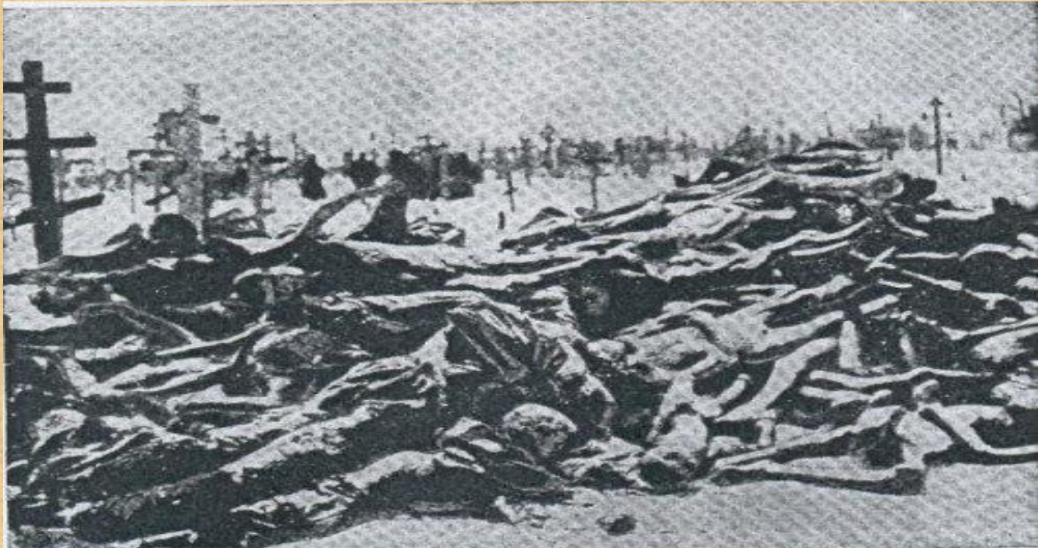
Кладовище в Харкові. Замерзлі трупи українських селян померлих з голоду. 1933 р.

За підсумками судової справи за фактом Голодомору було встановлено, що кількість людських втрат від Голодомору 1932-1933 років складає 3 мільйони 941 тисяча осіб. Втрати українців в частині ненароджених, що за даними слідства СБУ становлять 6 мільйонів 122 тисячі осіб судом не встановлювалися.