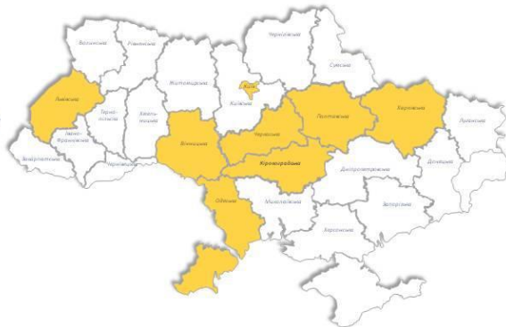
Рис. 2. Забезпечення превентивної комунікації поліцією

Як видно з рис. 2, причиною зростання довіри громадян стала сукупність факторів. Крім цього, протягом року перед поліцією постало багато серйозних викликів щодо забезпечення порядку та безпеки людей: це і фінал Ліги Чемпіонів УЄФА, і святкування річниці хрещення Київської Русі, і безпека під час проведення надважливого для всіх українців Собору щодо створення Автокефальної Помісної Православної Церкви України. Загалом правоохоронці з початку року забезпечили безпеку майже 86 тис масових заходів та зібрань громадян, в яких взяли участь понад 28 млн людей. Всі масові заходи пройшли спокійно. Комунікація з громадою стала номером один при забезпеченні безпеки. І