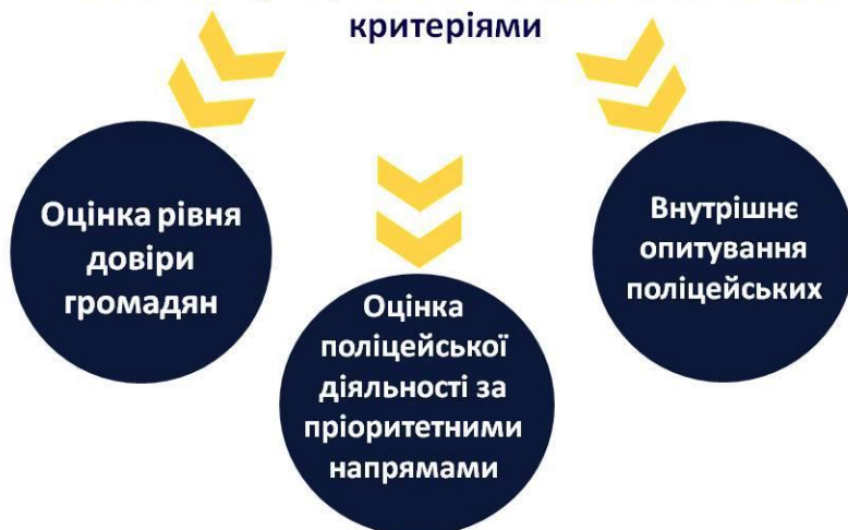
Рис. 1. Критерії оцінки поліцейської діяльності

Робота поліції оцінюється виключно за такими критеріями