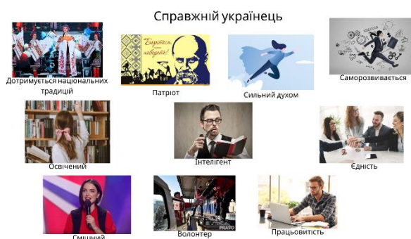
Рис.1 Типовий колаж «Справжній українець» (група «Молодь в Україні»)

Таким чином, молоді люди, що перебувають в Україні, мають більш конкретні та диференційовані уявлення про себе як представників української нації порівняно з однолітками, що знаходяться за кордоном. Водночас, кількість уживаних прикметників переконують, що афективна складова самооцінювання є більш вираженою у молоді, що перебуває за кордоном. Ця тенденція прослідковується і в результатах, отриманих нами під час проведення методики «Географія візуальних образів».