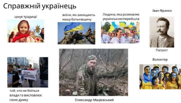
Рис.2 Типовий колаж «Справжній українець» (група «Молодь за кордоном»)

Факторний аналіз ставлення до нації за семантичним диференціалом (для всієї вибірки) уможливив визначити три чинники, такі: Суб'єктність , Комунікативна активність , Емоційність , що дуже нагадує універсальну факторну структуру Сила , Оцінка і Активність , виокремлену свого часу Ч. Осгудом. Однак у ставленні до нації в групі «Молодь за кордоном» було виокремлено чотири чинники, зокрема: Релевантність , Емоційність , Близькість , Щирість , водночас у групі «Молодь в Україні» лише три чинники: Релевантність , Асертивність і Емоційність .