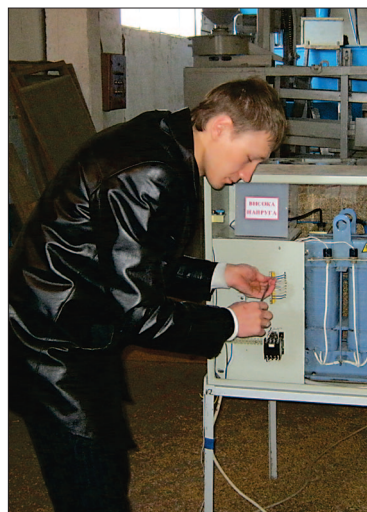
Закінчення на стор. 8

наукові стосунки з підприємствами електроенергетичного комплексу України – НЕК "Укренерго", "Центральна електрична система", "Київські магістральні мережі", ВАТ "АЕС Київобленерго", "Чернігівобленерго", "Черкасиобленерго", "Житомиробленерго", "Тепличний комбінат "Калинівський", "Птахофабрика "Березанська", ПАТ "Київсьелектро" та ін.